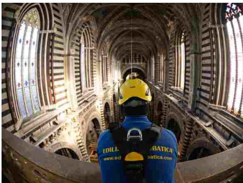
Edilizia acrobatica durante un intervento conservativo nel Duomo di Siena

«Durante i lavori di ripristino della facciata di un edificio, i condomini possono tranquillamente continuare ad affacciarsi dal loro balcone o dalla finestra, oltre ad essere più tranquilli in quanto a nessuno verrebbe in mente di arrampicarsi sulle pedane dell'impalcatura: tanto non ci sono, le pedane...». Un ragionamento 'di parte' (del fondatore di EdiliziAcrobatica), ma che non fa una grinza. Si riducono gli sprechi. Però, c'è dell'altro, parlando di qualcosa a metà tra una case-history e una indagine sul livello di sostenibilità di un metodo di lavoro. Lo scorso anno, infatti, gli operai con corda sono stati osservati, giorno dopo giorno, da Tetis Institute, spin-off dell'università di Genova, la quale, dopo aver valutato, tra gli altri, l'impatto ambientale di Expo 2015, Cortina 2021 e del consorzio Conserve Italia, è intervenuta su richiesta della stessa azienda leader nel settore dell'edilizia operativa in doppia fune di sicurezza.