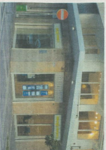
I locali dell'ex bar Brasile dove sorgono i nuovi uffici

La ditta specializzata in interventi senza ponteggi mette a disposizione otto posti Richiesti anche consulenti commerciali. I compensi vanno da 1.800 a 2.300 euro